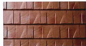
ストーン・オレンジ