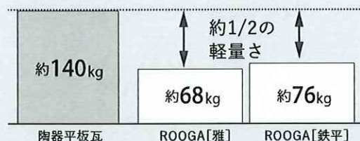
本体重量比較(1坪当り)

一般的な陶器平板瓦と同等の厚みを持ちながら、 重量はその約1/2という軽量さ。屋根が軽いと 地震の際に建物にかかる力を小さくできます。