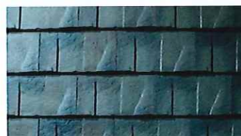
ストーン・グリーン