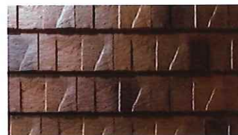
ストーン・オーク