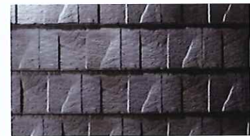
ストーン・シルバー