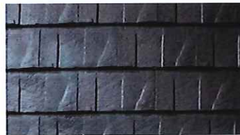
ストーン・ブラック